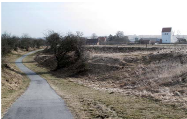
Udsigt over Vejby

Der er tilladt at ride langs ruten fra Skive Golfklub til Borgen ved Rødding.