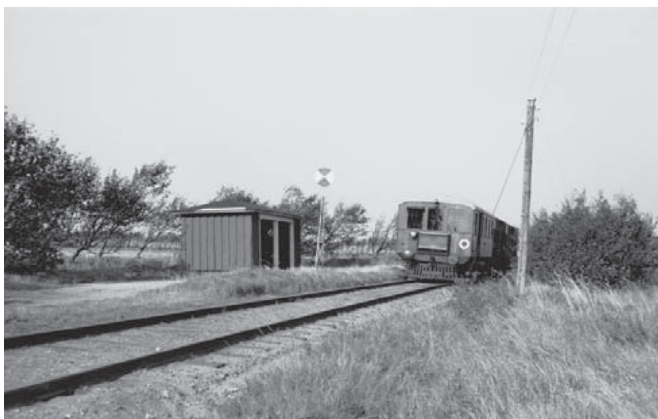
Nørhede Trinbræt 1965

Der var ikke mindre end 17 stoppesteder på ruten, så det tog lang tid at køre den forholdsvis korte strækning på 26,6 km.