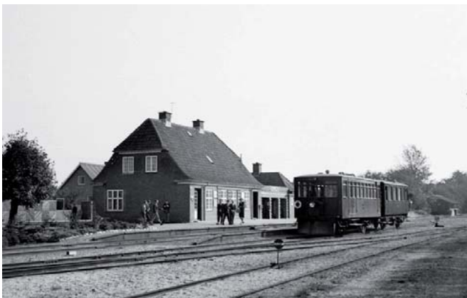
Balling Station 1965

Der findes, som det fremgår af kortet, rasteplasser og primitive overnatningspladser langs hele ruten. Den nærmere placering af raste- og overnatningspladser fremgår ligeledes af infotavlerne ved de enkelte landsbyer.